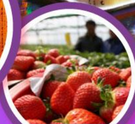
เก็บสตอร์วเบอร์รี่