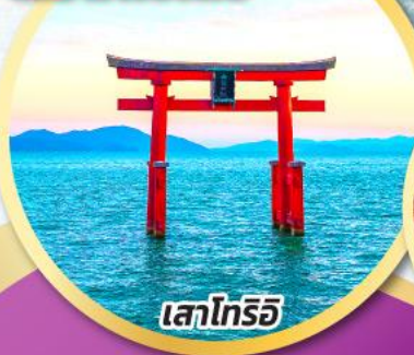
เสาโทริอิ