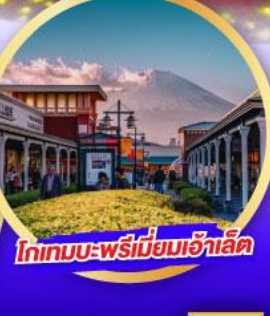
โกเทมบะ-พรีเมียมเอ้าเล็ท

เดินทาง 14-19 ม.ค. 68 21-26 ม.ค. 68 28 ม.ค.-02 ก.พ. 68