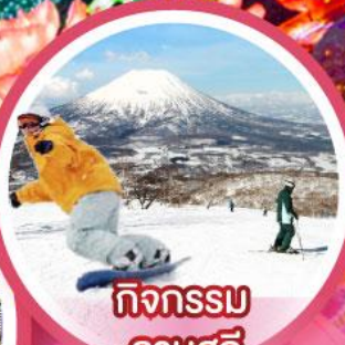
กิจกรรม ลานสกี