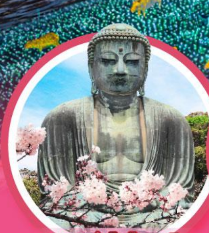
หลวงพ่อดโตโดบุตสึ