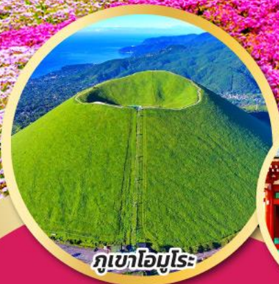
ภูเขาโอโมโระ