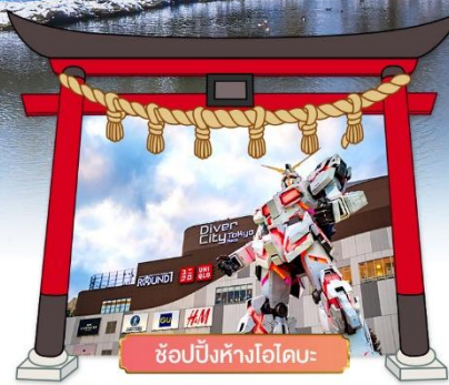
ช้อปปิ้งห้างไอโดบะ